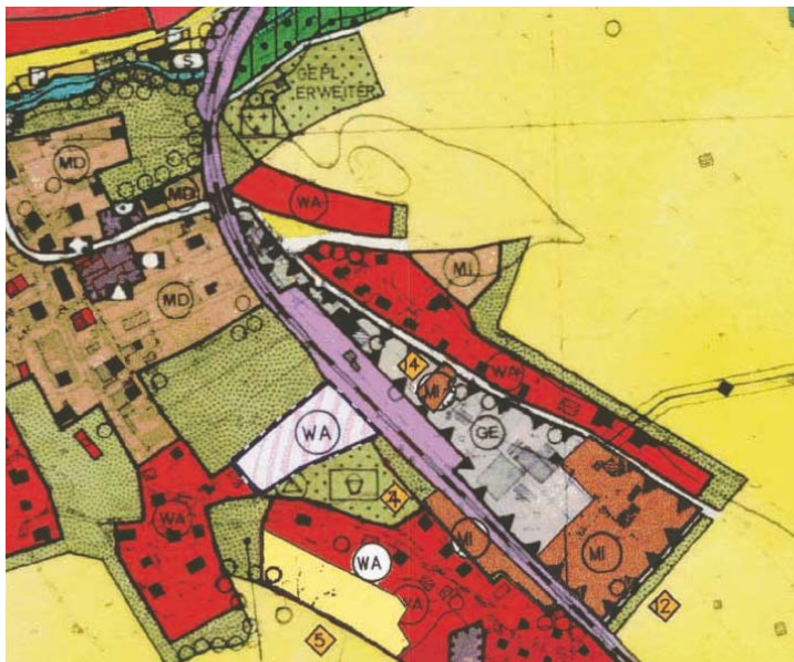
Ausschnitt des rechtskräftigen Flächennutzungsplans, o.M.

In der parallel zum Bebauungsplan laufenden Änderung des Flächennutzungsplans wird das Planungsgebiet als gewerbliche Baufläche sowie als Mischgebiet dargestellt.