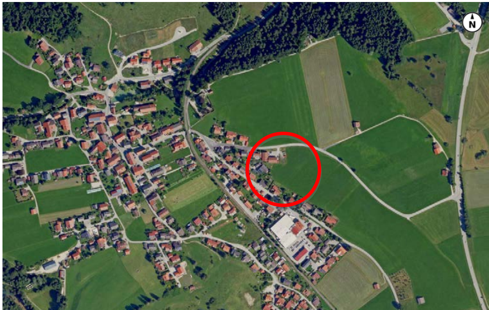
Luftbild, o.M.

Der Geltungsbereich des Bebauungsplanes befindet sich am östlichen Ortsrand von Altenau südlich der Oberen Dorfstraße, die von der B23 kommend in den Ort führt.