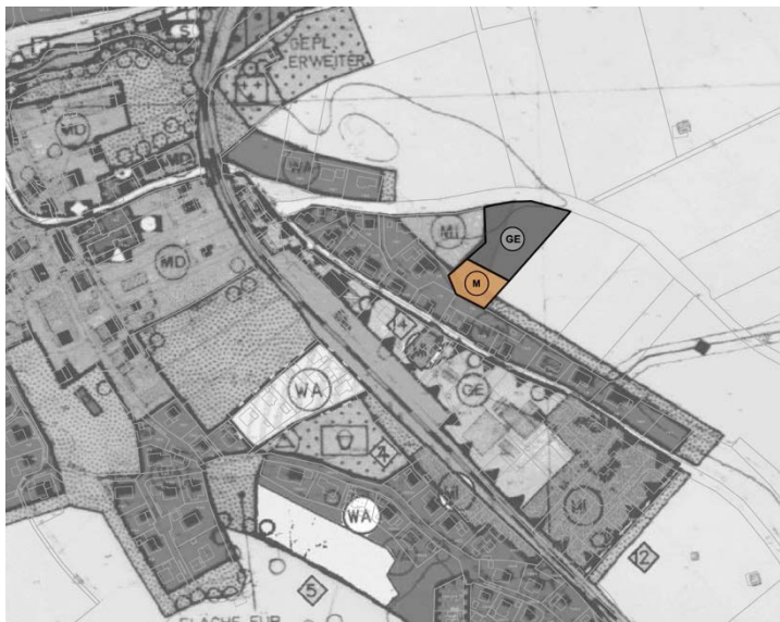
Ausschnitt der Änderung des Flächennutzungsplans, o.M.