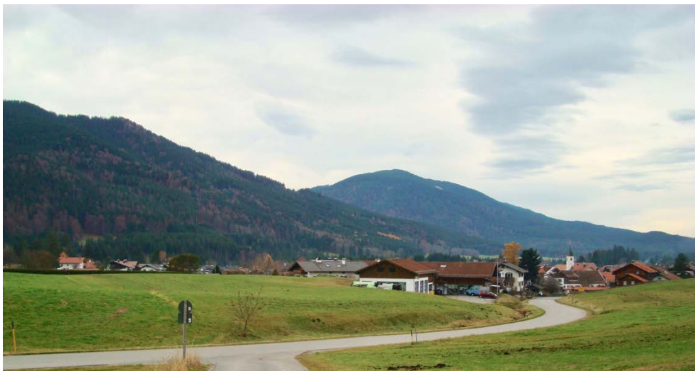
Blick von Osten auf das geplante Baugebiet

Das Grundstück ist topographisch bewegt und steigt entlang der Oberen Dorfstraße im Westen mit einer Höhe von 845,50 m ü. NN nach Osten auf 847,25 m ü. NN an und von dort sanfter nach Süden auf 848,50 m ü. NN.